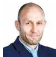
Argo Võigemast Maakler