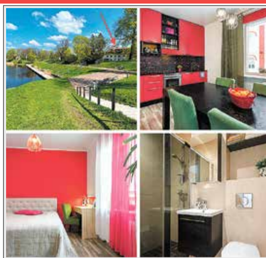
Õhtu põik 2, Pärnu Tõeliselt suur 3toaline korter, kõrge I korrus, üp 80,6 m². Uus hind 145 000 €