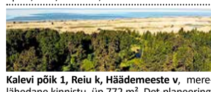
Kalevi põik 1, Reiu k, Häädemeeste v , mere lähedane kinnistu, üp 772 m². Det-planeering. 63 000 €. Mai