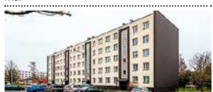
Mai tn , 4toaline renoveeritud korter, üp 70,9 m², IV korrus, rõdu. Korteriist vaade merele. 98 000 €. Sirje