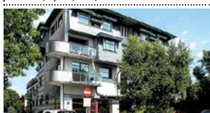
Tammsare pst 10c , 3toaline korter/äripind ran-

na rajoonis. Üp 110 m², kaks tasapinda, eraldi sissepääs, WC/duširuum, saun. 180 000 €. Sirje