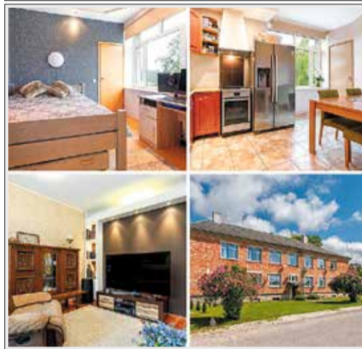
Keraamika 10 Suure hoovialaga majas võrratu 2toal korter, üp 61,5 m². 69 000 €