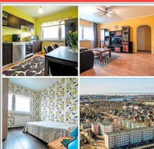
Lille 51, Pärnu 3toaline rõduga korter. BRONEERITUD. 64 000 €