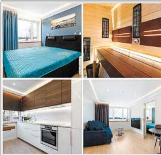
Varbola keskuse superkodu Mööleeritud 3toaline korter saunaga. 119 000 €