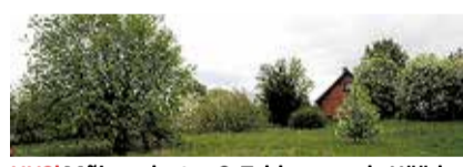
UUS! Mõisavahe tee 9, Tahkuranna k, Häädemeeste v, elamumaa 1297 m². 12 000 €. Sirje