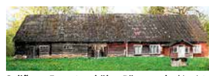
Seliõue, Eametsa küla, Pärnu mk , kinnistu üp 10 592 m², taluhoone, maakivi kelder, ait. 47 000 €. Sirje