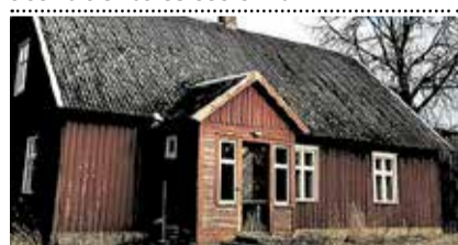
Rannajaago, Piirumi k, Häädemeeste v , palkmaja üp 113,7 m² / 9295 m², 4 tuba, ahiküte. Laut, kuur, ait, maakividest kelder. 39 500 €. Mai