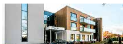
UUS HIND! Aisa 39, 1toaline kahe rõduga korter ranna rajoonis, üp 31 m², III k. 95 900 €. Janely