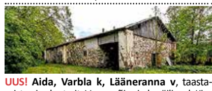
UUS! Aida, Varbla k, Lääneranna v, taastamist vajav laut-ait. Vana mõis ei ole säilinud. Kinnistu 5169 m². 42 000 €. Mai