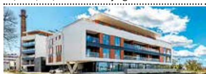
Ringi 60 , 2toaline korter 2019. a valminud jõeäärses majas, üp 46,2 m², II k. 148 000 €. Mai