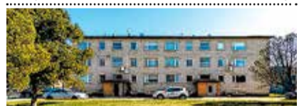
Aisa tee 12, Jõõpre k , 4toaline korter, üp 63 m², III k, kamin, õhksoojuspump. Toad eraldi, WC/duširuum. 37 000 €. Mai

na rajoonis. Üp 110 m², kaks tasapinda, eraldi sissepääs, WC/duširuum, saun. 180 000 €. Sirje