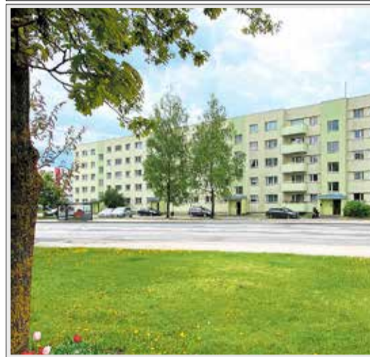
Mai 51 Majalaenu rõduga korter ootab remondiarmastajast omaniku! Üp 46,6 m². 49 999 €