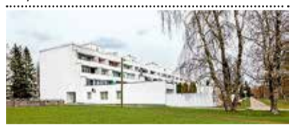
UUS HIND! Kuldse Kodu 1, 4toaline korter, üp 78,3 m², II k, panipaik, kelder, garaaž. 75 000 €. Mai