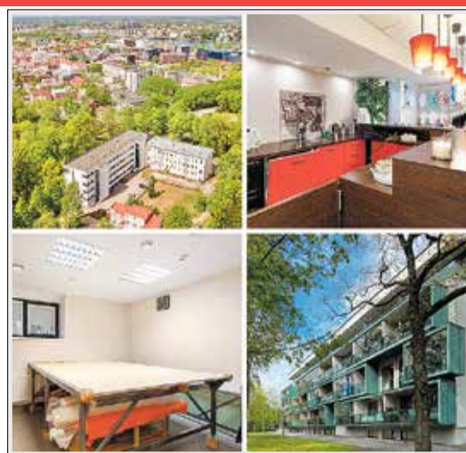
Jalaka 10, Pärnu Ruumikas äripind kesklinnas, üp 136 m². 175 000 €