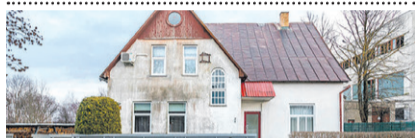
UUS! Vingi 2 , 2toal korter, üp 40,2 m 2 , II k, läbi maja planeering, ahiküte. 79 900 € . Mai