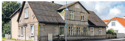
Haapsalu mnt 32 , 2toal korter, üp 45,5 m 2 , I k, ahiküte, vajab remonti. 54 500 € . Sirje