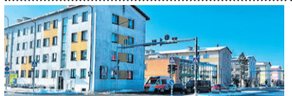
UUS! Tallinna mnt 4 , 2toal korter, üp 36,7 m 2 , I k, renoveeritud. 77 500 € . Mai